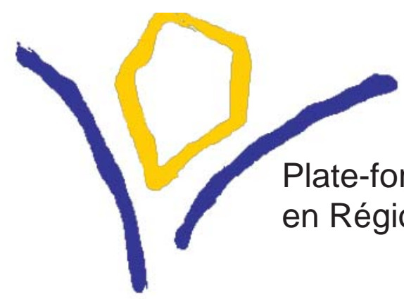
Plate-forme de Concertation pour la Santé Mentale en Région de Bruxelles-Capitale